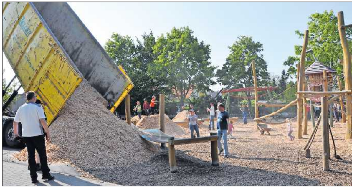
Mit dem Radlader waren die Hackschnitzel schnell am Bestimmungsort.

Aus dem Erlös von Kerwe, Weihnachtsmarkt und Weihnachtsmarkt-Tombola wurden 1500 Euro in den